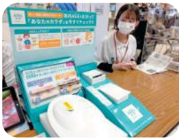
健康測定 (Inbody・血管年齢・体内AGEs) 名桜大学ヘルスサポート