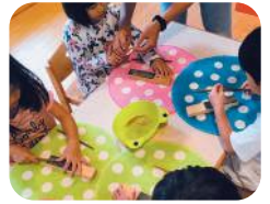
県産木材で作る 『マイ箸作り体験』

工房うるはし 参加費 中学生以上:1,000円 3歳~小学生:500円 約1時間/各回12名まで ①10:30~②12:30~ ③14:00~④15:30~ ※当日10時以降会場で随時 申し込みを受け付けます。