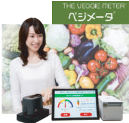
野菜足りてますか？ 指1本で簡単チェック 『ベジメータ®』