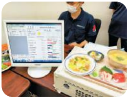
食育SATシステム体験 栄養相談 沖縄県栄養士会