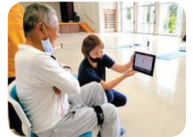
DEIGOS 女子サッカー選手 と測定しよう！ 『体力測定』 エナジック琉球デイゴス

工房うるはし 参加費 中学生以上:1,000円 3歳~小学生:500円 約1時間/各回12名まで ①10:30~②12:30~ ③14:00~④15:30~ ※当日10時以降会場で随時 申し込みを受け付けます。