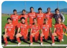
エナジック 琉球デイゴス